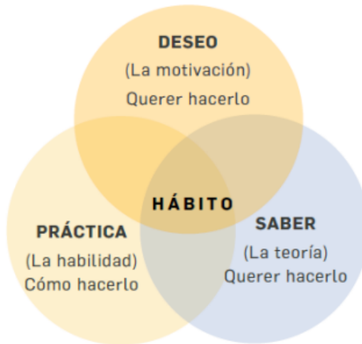
Gráfico 5. Cómo formar hábitos con efectividad. Fuente: Juan Carlos Jiménez 2016 / Plan Nacional de Formación y Capacitación 2020 – 2030